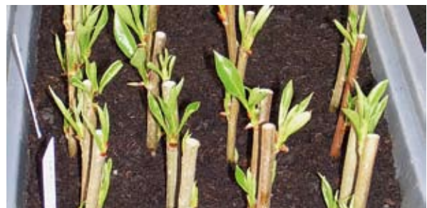
Abb. 3: Zur Untersuchung der stimulierenden Wirkung endophytischer Bakterien werden Pappelstecklinge mit bestimmten Bakterienstämmen beimpft und dann hinsichtlich ihrer Wachstumseigenschaften charakterisiert