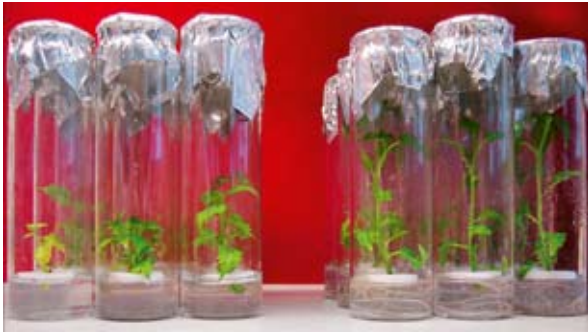
Abb. 2: Im Labor-Test steigert ein endophytischer Bakterienstamm der Gattung Stenotrophomonas das Spross- und Wurzelwachstum von Pappelpflanzen signifikant (links: unbeimpfte Variante, rechts: beimpfte Variante)

zeitmassenspektrometrie (GC/TOF-MS) gekoppelt. Um den Einfluss anderer Endophyten weitgehend auszuschließen, wurden auch hier Pappelpflanzen aus der Laborzucht verwendet, die frei von kultivierbaren endophytischen Bakterien waren. Nach Inokulation mit einem Paenibacillus -Stamm, der in Vorversuchen die Wurzelbildung stimuliert hatte (siehe oben) wurden diese Pflanzen und die entsprechende unbeimpfte Kontrolle untersucht.