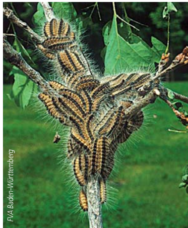
Raupen des Eichenprozessionsspinners

2007 in enger Zusammenarbeit mit den Forstlichen Versuchsanstalten der Bundesländer eine Karte erstellt, die für ganz Deutschland die Regionen zeigt, in denen mit Problemen durch die Raupen des Eichenprozessionsspinners zu rechnen ist. In den markierten Gebieten kann die Dichte des zu Massenvermehrungen neigenden Insekts so groß werden, dass Auswirkungen auf die Gesundheit der Waldbesucher befürchtet werden müssen. Neben Wäldern befällt der Schädling auch Bäume in Parkanlagen und anderen städtischen Bereichen.