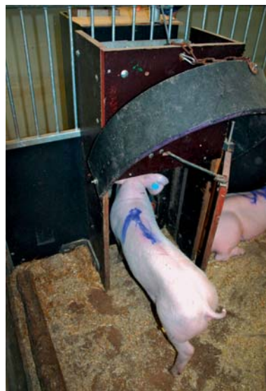
Schwein vor einem Ton-Schalter-Futterautomaten in der Experimentalanlage des FBN

Wissenschaftler des Forschungsinstituts für die Biologie landwirtschaftlicher Nutztiere (FBN) in Dummerstorf bei Rostock haben untersucht, inwieweit eine angereicherte Haltungsumwelt, die den Tieren mehr Beschäftigung und weniger Langeweile sowie regelmäßige Bewegung bietet, die Fleischqualität verbessert. Bei dieser Untersuchung wurden Schweine der Deutschen Landrasse in den am FBN entwickelten Ton-Schalter-Futterautomaten gefüttert. Mit einer kurzen Tonfolge, die einem Handy-Klingelton vergleichbar ist, rufen Ton-Schalter-Futterautomaten die Tiere achtmal am Tag zum Futter. Da jedem Tier eine eigene, unverwechselbare Tonfolge zugeordnet ist, reagieren die Artgenossen nicht und das individuell angesprochene Tier kann ungestört am Ton-Schalter-Futterautomaten fressen. So werden drei Ziele auf einmal erreicht: Die Tiere werden beschäftigt, was die Lethargie und Langeweile abbaut und so der Tiergerechtigkeit dient, die Fütterungssituation wird entspannt, was den Stress vermindert, und schließlich wird die Fleischqualität verbessert. Vermutlich beruht dieser Effekt hauptsächlich auf den zwei Faktoren Stressminderung und Bewegungsförderung. Es zeigte sich nämlich, dass der Anteil roter Ausdauerfasern bei den mit den Ton-Schalter-Futterautomaten gefütterten Schweinen im Vergleich zu