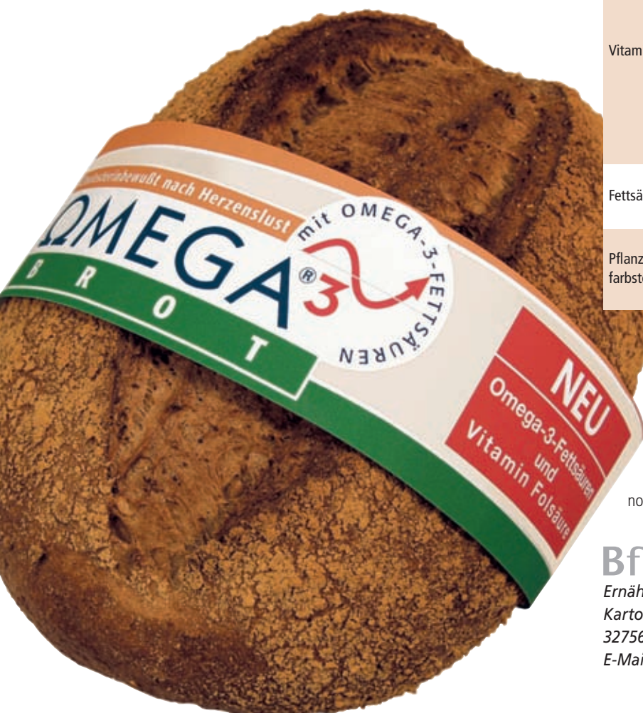
Abb. 3: Omega-3-Brote haben einen erhöhten Anteil an mehrfach ungesättigten Fettsäuren der Omega-3-Reihe.