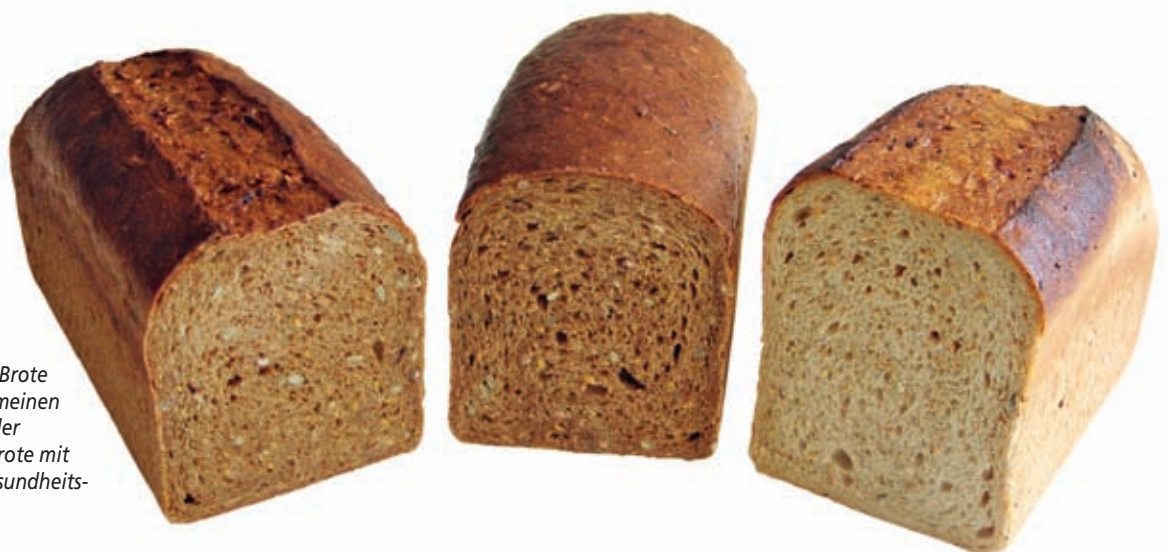
Abb. 2: Mit dem Begriff Wellness-Brote werden im allgemeinen Vollkornbrote oder Vollkornschrot-Brote mit gesteigertem Gesundheitswert bezeichnet.

Um eine Anreicherung eines Brotes mit einer bestimmten Substanz über das Maß hinaus, mit der sie natürlicherweise im Getreiderohstoff vorkommt, zu erzielen, bedient man sich des Zusatzes ausgewählter anderer pflanzlicher Rohstoffe oder Komponenten davon. Als Beispiele mögen Inuline (Beta-Fructane) aus Zichorien, Vitamine, Fettsäuren, Ballast- und Mineralstoffe aus Amaranth, Quinoa, Soja-