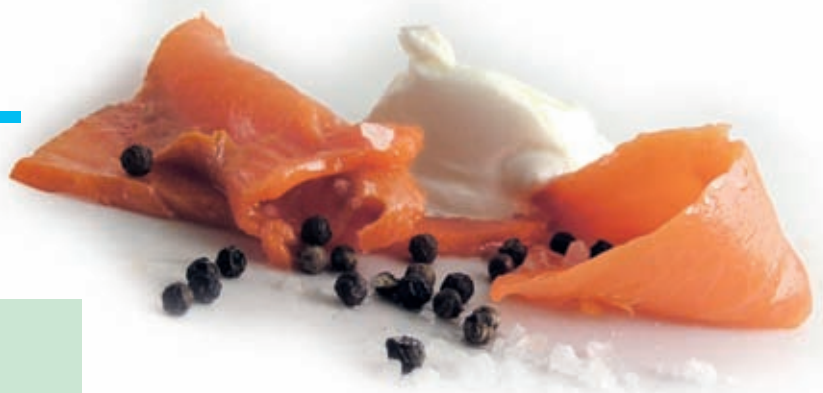
Abb. 1: Die Omega-3-Fettsäure-Familie