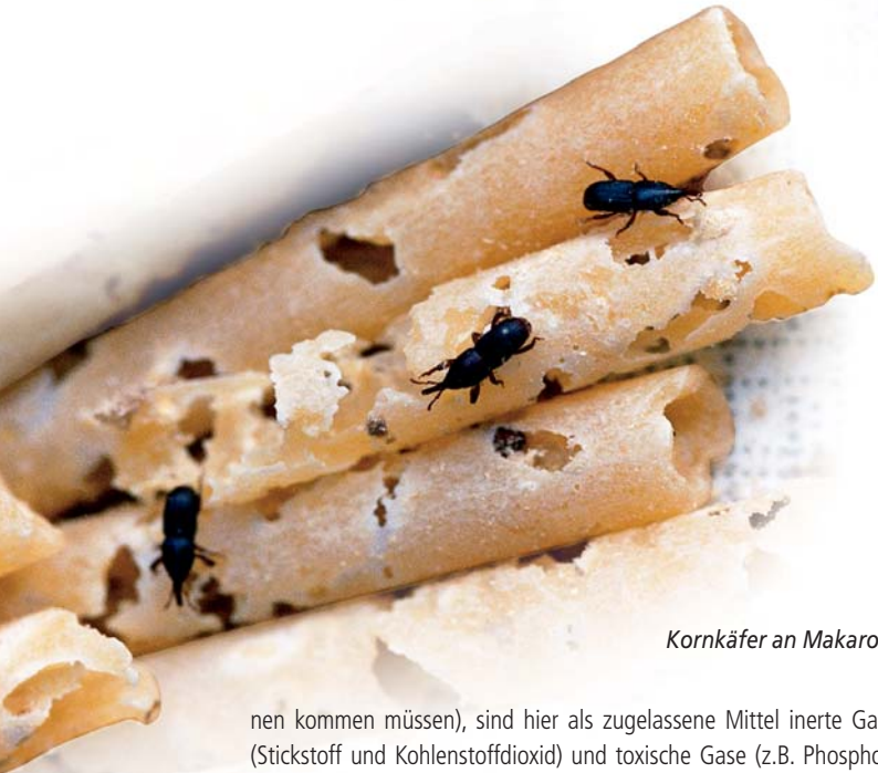
Kornkäfer an Makaroni

nen kommen müssen), sind hier als zugelassene Mittel inerte Gase (Stickstoff und Kohlenstoffdioxid) und toxische Gase (z.B. Phosphorwasserstoff und Sulfuryldifluorid) zu nennen. Der Einsatz toxischer Gase ist inzwischen sehr präzise und restriktiv geregelt, um mögliche Unfälle – auch durch Fehlgebrauch – möglichst auszuschließen. Die neue Technische Regel für Gefahrstoffe (Begasungen) Nr. 512 wurde kürzlich unter Mitarbeit des BBA-Instituts für Vorratsschutz überarbeitet und vom zuständigen Ausschuss des Arbeitsministeriums genehmigt. Sie wird demnächst publiziert werden.