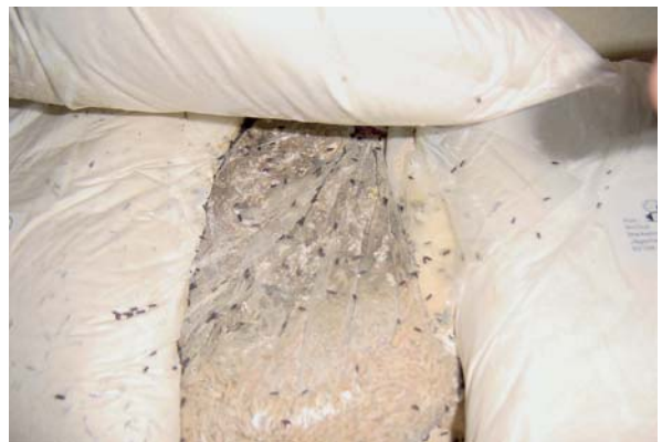
Getreide mit massivem Kornkäferbefall

on von Verfahren, bei denen unter vorrangiger Berücksichtigung physikalischer, biologischer, lagertechnologischer sowie verpackungsschützender und hygienischer Maßnahmen die Anwendung chemischer Pflanzenschutzmittel auf das notwendige Maß beschränkt wird. Auch hier gilt: Vorbeugen ist besser als Heilen (hier: Bekämpfen der Schädlinge). Daher wird einer regelmäßigen Überwachung (Monitoring) und der Früherkennung der Schadtiere große Bedeutung beigemessen. Wenn ein Befall frühzeitig erkannt oder verhindert werden kann, lassen sich Bekämpfungsmaßnahmen auf ein Minimum reduzieren.