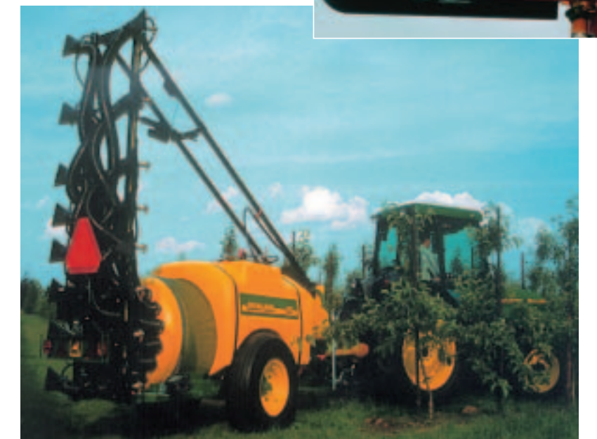
Deutliche Entlastung der Umwelt: Bis zu 30 Prozent der Pflanzenschutzmittelmengen im Obstbau können durch sensorgesteuerte Sprühgeräte eingespart werden. Kleines Bild: Düse-/Sensor-Einheit.