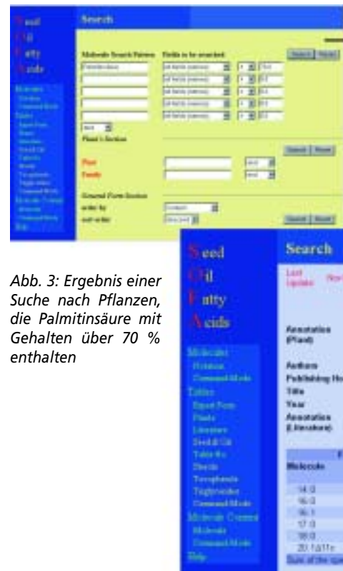
Abb. 3: Ergebnis einer Suche nach Pflanzen, die Palmitinsäure mit Gehalten über 70 % enthalten