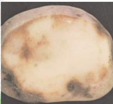
Abb. 1: Kraut- und Braunfäule der Kartoffel, verursacht durch Phytophthora infestans .

von Kreuzungsnachkommen, um gute Zuchtklone herauszufinden. Tabelle 1 zeigt die Gegenüberstellung beider Resistenzformen der Kartoffel gegenüber Phytophthora infestans . Aus dem Vergleich geht auch hervor, dass die relative Resistenz arbeitsaufwändigere Bewertungsmethoden und mehrjährige Prüfungen voraussetzt. Doch dies wird in Kauf genommen für die lang andauernde Wirkung gegen alle Pathotypen oder Rassen. Das BAZ-Institut für landwirtschaftliche Kulturen kann auf diesem Gebiet Erfolge vorweisen, die für die Züchtung unempfindlicher Kartoffelsorten von großer Bedeutung sind.