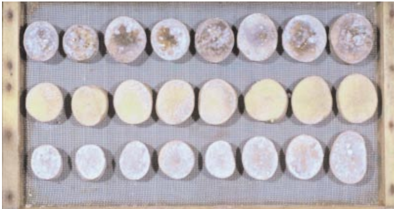
Abb. 5: Braunfäuleresistenzprüfung im Scheibentest 6 Tage nach Tropfinokulation.

aus einem anderen Samen hervor und ist genetisch anders als ihre Nachbarn. Während die linke Familie fast nur anfällige Pflanzen enthält, zeichnen sich die Nachkommen in der rechten Kiste weitgehend