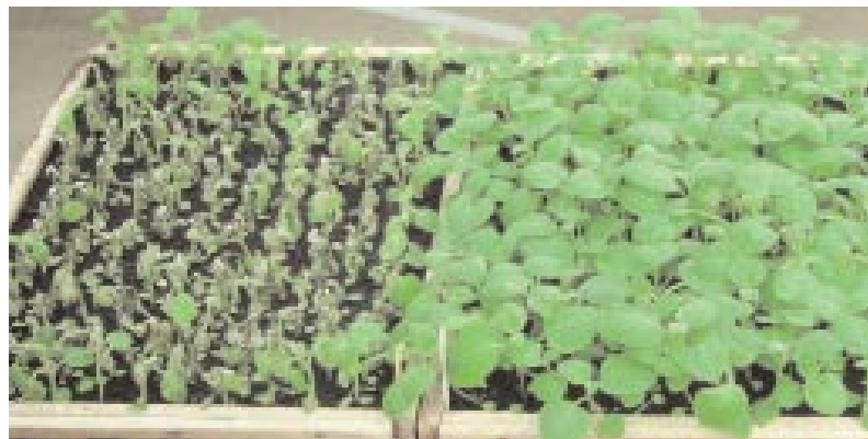
Abb. 2: Auslese von Kartoffelsämlingen auf Krautfäuleresistenz. Links anfällige Population. Rechts Familie mit hohem Anteil hoch resistenter Pflanzen.

land auf etwa 470 Euro/ha (150 Euro für die chemische Bekämpfung, 250 Euro Ertragseinbuße, 70 Euro Verlust durch Braunfäule). Im Laufe der letzten 20 Jahre ist der Miteinsatz durch verbesserte Prognoseverfahren und eine verfeinerte Bekämpfungssteuerung zurückgegangen. Einige Fungizide sind unwirksam geworden, weil sich der sehr wandlungsfähige Erreger an den wiederholten Einsatz angepasst hat. Auch das in den letzten Jahren beobachtete frühere Auftreten der Krautfäule wird durch eine Anpassung – das bessere Überleben von Phytophthora im Lager oder der Oosporen-Überwinterung im Boden – erklärt. Deshalb ist die Kraut- und Braunfäule nach fast 160 Jahren Forschung noch immer die wichtigste Kartoffelkrankheit. Das Schädigungspotenzial von Phytophthora infestans ist so hoch, dass grundsätzlich alle bekannten und bewährten Bekämpfungsmaßnahmen voll ausgenutzt werden müssen.