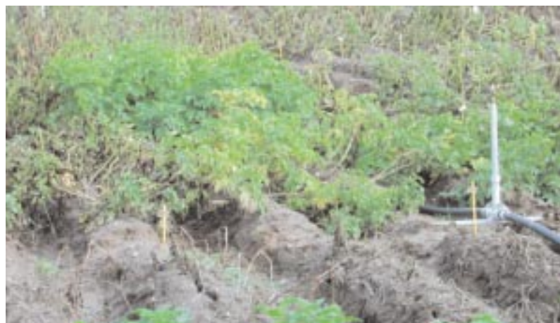
Abb. 4: Feldprüfung auf relative Krautfäuleresistenz mit Ausbringung des Erregers und Beregnung. Mittelefrüher hoch resistenter Zuchtstamm, umgeben von anfälligen bis mittel resistenten Klonen.

Es ist durchaus möglich, grobe Unterschiede in der Resistenz von Pflanzen im Reagenzglas festzustellen. Je näher aber die Testverfahren den Anbaubedingungen