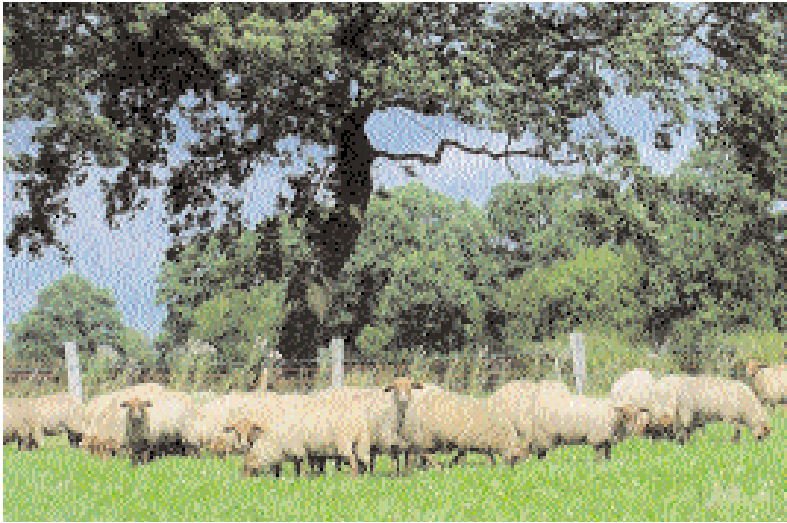
Schafe der Rasse Coburger Fuchse

nisch über die Haltung von gefährdeten Nutztierassen befragt (Tab. 1). Daneben hält das Institut auch selber verschiedene Rassen von Nutztierarten, die als tiergenetische Ressourcen eine Rolle spielen. Bei den Fleischschafen sind dieses die Coburger Fuchsschafe, Bentheimer Landschafts- und Rhönschafe. Bei den Rindern werden auch Angler Rinder (Nutztierrasse des Jahres 2002) und Rotbunte des alten Schlages gehalten, bei den Schweinen Angler Sattelschweine. Der Versuchsbetrieb wurde in die Liste der ARCHE-Höfe der Gesellschaft für gefährdete Haustierrassen ( www.G-E-H.de ) aufgenommen, die sich besonders um die Erhaltung „alter Rassen“ bemühen.