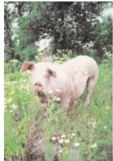
Weidehaltung von Schweinen

ment(inn)eninteresse nach rückstandsarmen Lebensmitteln und der Forderung nach einer Reduktion der Umweltkontamination durch Arzneimittel entgegen. Die meisten der zurzeit etablierten ökologischen Bekämpfungskonzepte gegen Weideparasiten haben zum Ziel, die Konzentration der Infektionserreger auf der Weide zu „verdünnen“. Mit einem gezielten Weidemanagement lassen sich die Infektionsstadien der Würmer maßgeblich reduzieren. Dieses Potenzial wurde bisher in der Praxis jedoch kaum genutzt. Am Institut für ökologischen Landbau werden zu die-