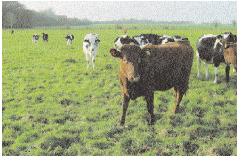
Angler Rind (Gefährdete Nutztierrasse 2002) und Holstein Frisian Rinder

b) Die zweite Untersuchung wird mit Rindern verschiedener Altersgruppen durchgeführt. Ältere Rinder sind weitgehend unempfindlich gegen Wurmbefall. Die belastungsfähige Immunität, die ältere Rinder bereits ab ihrer zweiten Weideperiode (zweitsommerig) entwickelt haben, kann dahingehend genutzt werden, dass empfängliche Jungtiere nur auf bereits von älteren Tieren