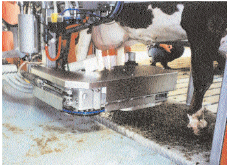
Abb. 4: Automatisches Melksystem – Roboterarm mit angesetztem Melkzeug

Herdenmanagementsysteme, die derzeit fast ausschließlich der Produktionskontrolle und -steuerung dienen, könnten diese erweiterte Funktion künftig übernehmen. Voraussetzung für eine „Gläserne Produktion“ ist eine lückenlose Dokumentation von Daten sowohl der Gesundheitsüberwachung als auch der