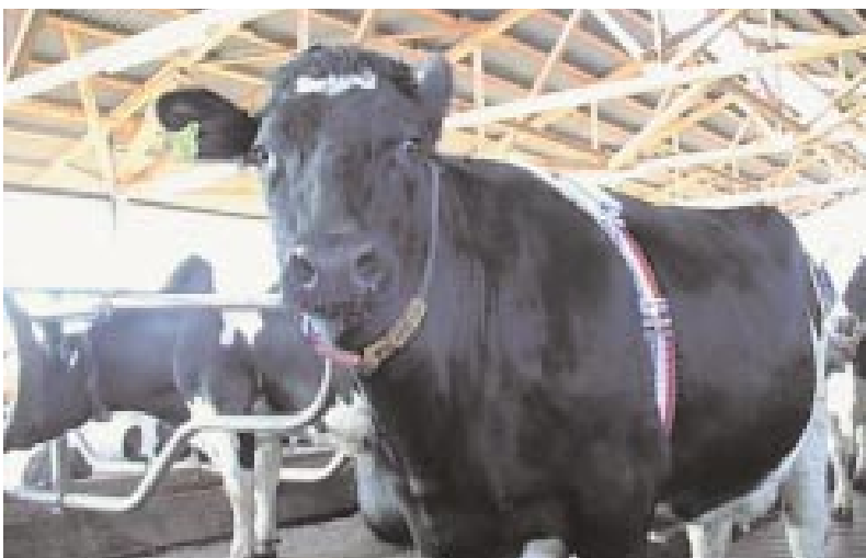
Abb. 1: Kuh mit Halstransponder zur Tieridentifikation