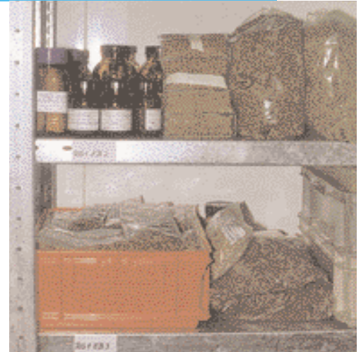
Ressourcen (FGR), Aquatischen Genetischen Ressourcen (AGR) und die Mikrobiellen Genetischen Ressourcen (MGR).

Das BMVEL hat – mit wissenschaftlicher Unterstützung der Bundesforschungsanstalten – eine Konzeption erarbeitet, um die Situation der genetischen Ressourcen für Landwirtschaft, Forsten und Fischerei zu evaluieren. Da die Situation der genetischen Ressourcen in den verschiedenen Bereichen sehr unterschiedlich ist, sind spezielle Fachprogramme vorgesehen. Diese umfassen die Bereiche der Pflanzengenetischen Ressourcen (PGR), Tiergenetischen Ressourcen (TGR), Forstgenetischen