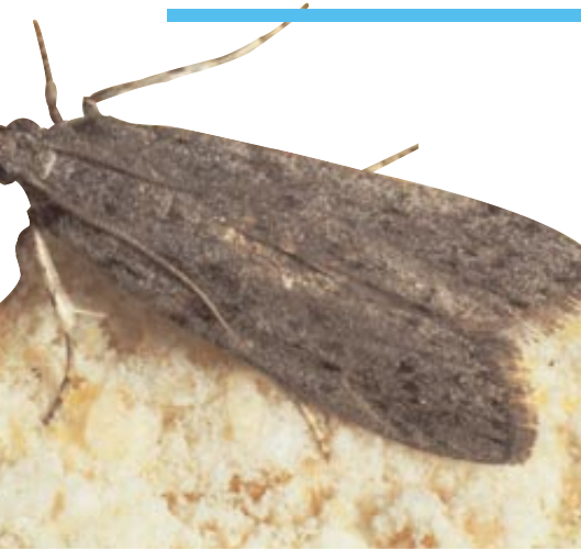
Die Dörr-obstmotte ( Plodia interpunctella ), ein häufiger Vorratsschädling im Haushalt

mäßiger Überwachung kaum mit Problemen zu rechnen. War dies im Einzelfall nicht erfolgreich, gilt es, einen Befall so früh wie möglich festzustellen, damit zum Beispiel die Gespinste vorratsschädlicher Motten nicht die Verarbeitungsmaschinen verstopfen.