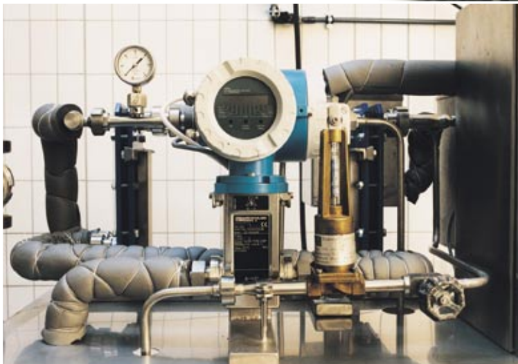
Abb. 3: Laboranlage zur experimentellen Kurzzeiterhitzung von Milch (Übersicht und Ausschnitt)

Deshalb ist es nicht auszuschließen, dass Autoren, die über eine völlige Inaktivierung von M. paratuberculosis nach Erhitzung der Milch berichten, zu diesem Ergebnis nur kamen, weil sie ihre Versuche zu früh beendet haben. Mit dem neuen Verfahren waren bei 42,3 % der Versuche vermehrfähige M. paratuberculosis nachweisbar. Bei der Gegenüberstellung der positiven und negativen Ergebnisse in Form eines Punkteschwarmes zeigt sich keine besondere Schwerpunktbildung (Abb. 4). Das bedeutet, das Überleben der Erhitzung ist unabhängig von der Ausgangskeimzahl und den hier geprüften Temperatur-Zeit Bedingungen.