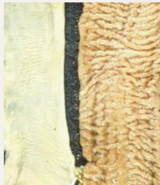
Abb. 1: Typische Auffaltung des Dünndarms bei Paratuberkulose

M. paratuberculosis ist beim Rind und anderen Wiederkäuern der alleinige Verursacher der Paratuberkulose, auch Johnesche Krankheit genannt. Diese Erkrankung bricht bei Milchrindern meistens nach der zweiten oder dritten Kalbung