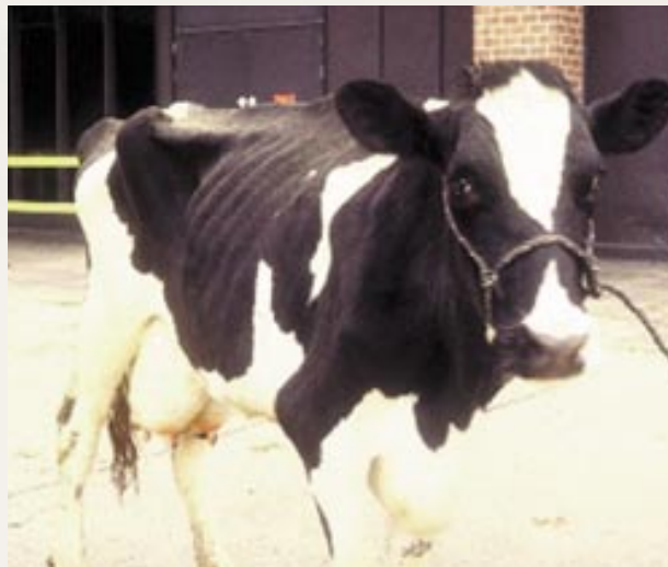
Abb. 2: Klinisch an Paratuberkulose erkrankte Holstein-Friesian Kuh

In Deutschland leiden circa 175.000 Personen an Morbus Crohn. Die Erkrankung ist eine Multifaktorenkrankheit; als Auslöser kommen unter anderem erbliche, diätetische, immunologische und psychische Faktoren in Betracht.