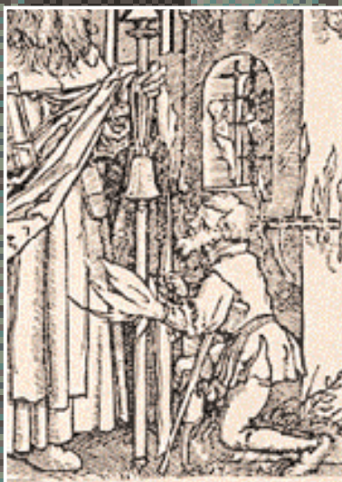
Abb. 1: Mutterkornvergiftung in einer mittelalterlichen Darstellung: Das 'Antoniusfeuer' lodert aus der linken Hand des schmerzgequälten Mannes, der bereits den rechten Fuß – wohl auch infolge der Vergiftung – verloren hat.

schmerzhaften Absterben der Akren, insbesondere von Fingern und Zehen (Abb. 1).