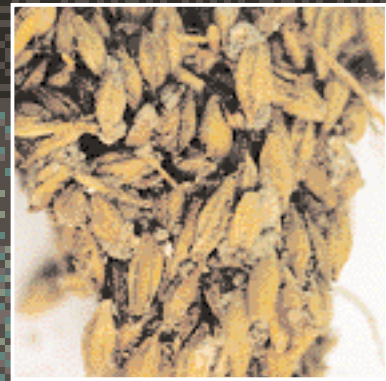
Durch Schimmelpilze verdorbenes Getreide

Die Erkrankungen durch Mykotoxine werden als Mykotoxikosen bezeichnet, wobei für deren Entstehen sowohl beim Menschen als auch bei den Nutztieren die Aufnahme kontaminierter Lebens- und Futtermittel wichtigste Bedeutung besitzt. Darüber hinaus besteht auch eine Expositionsgefahr durch mykotoxinhaltige Stäube. Nahezu 60 Länder haben Bestimmungen zur Kontrolle von Mykotoxinen (vor allem Aflatoxine) in Lebens- und Futtermitteln erlassen oder vorgeschlagen.