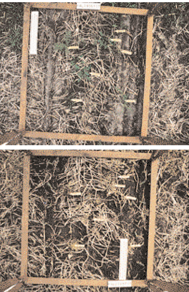
Abb. 4: Feldauschnitt mit markierten Unkräutern vor der Spritzung (oben) und nach der Spritzung (unten)

Die Simulation von grünen Pflanzen ist möglich durch die Verwendung einer Mischung von Mineralpigmenten (Ti, Ni, Zn), die zusammen mit rein pflanzlichen Bindemit-