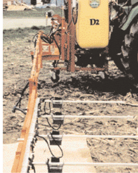
Abb. 3: Abgleich des Systems Detectspray über Jute

Bei einem Vergleichstest des konventionellen mit dem weiterentwickel-