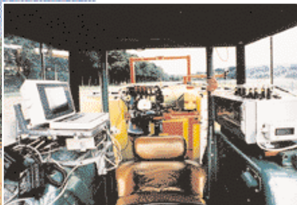
Abb. 2: Datenerfassung auf dem Versuchsschlepper

Für den Aufbau eines solchen Systems auf einer handelsüblichen Feldspritze benötigt man Spritzsensoren, die jeweils mit einem Magnetventil und einer Spritzdüse zusammenarbeiten. Diese Spritzsensoren weisen zum Boden und empfangen das reflektierte Tageslicht. Die Nachführung an veränderte Tageslichtbedingungen geschieht mit einem Umgebungslichtsensor, der mit den gleichen Photodioden und Filtern ausgerüstet ist und das Tageslicht direkt empfängt. Die Steuerung des Systems übernimmt ein sogenannter Spritzmonitor, an dem alle erforderlichen Einstellungen vorgenommen werden. Über einen BUS arbeiten alle Komponenten zusammen. Das System wird von uns auf Versuchs-