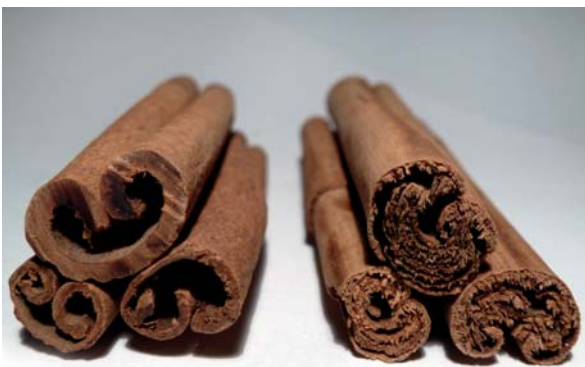
Abb. 4: Zimtstangen im Vergleich: links Cassia-Zimt mit dicker Rinde, rechts der Cumarin-arme Ceylon-Zimt.

Die Frage, ob ein Pflanzeninhaltsstoff, der in die Zellstrukturen der Pflanze (so genannte Pflanzenmatrix) eingebunden ist, beim Verzehr der Pflanze für den Körper genauso bioverfügbar ist wie die isolierte Substanz, ist nicht allgemein vorhersagbar. Für jede Kombination von Substanz und Pflanzenmatrix kann die Bioverfügbarkeit