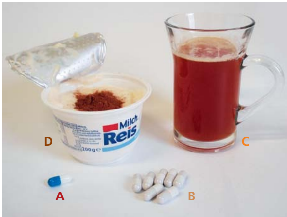
Abb. 1: Zubereitungen der Studie