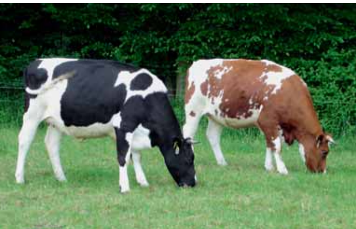
Abb. 1: Die zwei für den Vergleich herangezogenen Rinder-rassen: die standorttypische Deutsche Rotbunte und die weit verbreitete Deutsche Holstein – Schwarzbunte

„Prävention statt Therapie“ ist eine Forderung des Ökologischen Landbaus zur Erhaltung der Tiergesundheit. Neben einer tiergerechten Haltung und Versorgung fordern die Richtlinien deshalb auch die Nutzung standortangepasster Rassen für die ökologische Tierproduktion. Seit 2004 vergleichen wir deshalb auf unserem Versuchsbetrieb die in der konventionellen wie in der ökologischen Milchproduktion weit verbreitete milchleistungsorientierte Deutsche Holstein – Schwarzbunte (DH) mit der standorttypischen Deutschen Rotbunten im alten Doppelnutzungstyp (Rbt) (Abb. 1). Im spiegelbildlich aufgebauten Stall werden die beiden Herden (je 50 Tiere) zwar getrennt voneinander, aber unter den gleichen Managementbedingungen (Aufstallung, Fütterung, Melken) gehalten (Abb. 2). In einem langfristigen Monitoring werden zahlreiche Daten rassespezifisch erfasst (z. B. zur Leistung und zur Gesundheit) und miteinander verglichen.