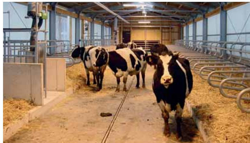
Abb. 2: Blick in die eine Hälfte des Milchviehstalls in dem Trenthorster Forschungsinstitut