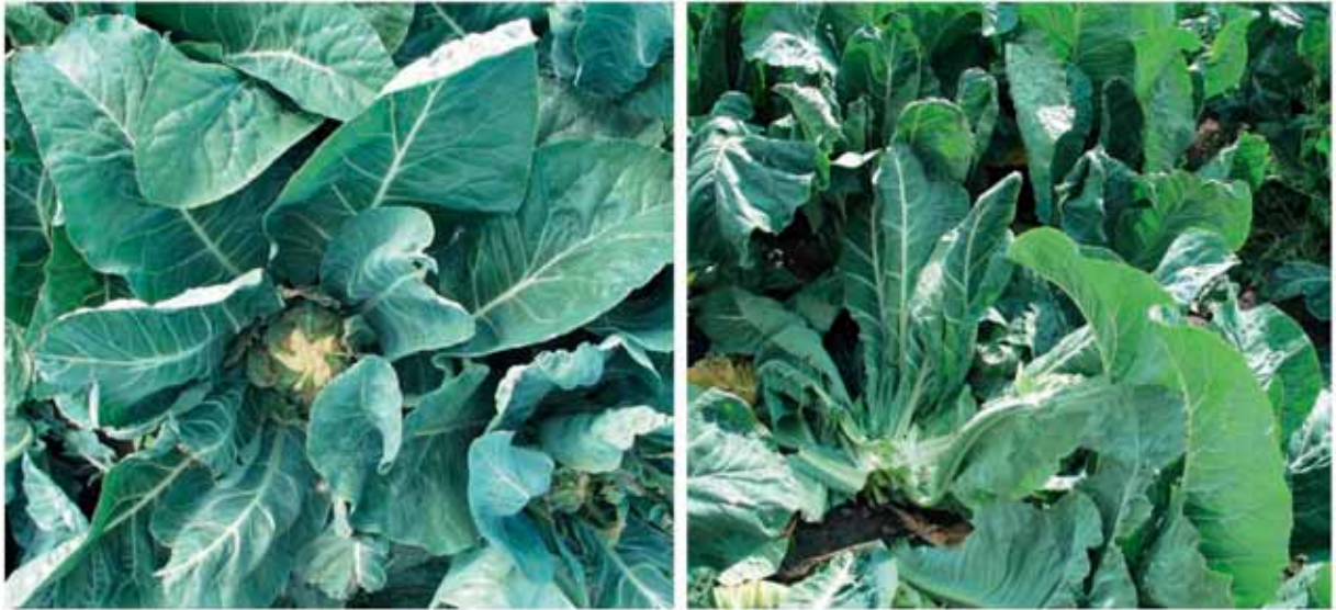
Abb. 2. Blumenkohl vor (links) und nach (rechts) der Ernte. Manche Gemüsearten hinterlassen große Mengen an Ernterückständen, da die geernteten Produkte nur einen geringen Anteil der gesamten Pflanzenmasse ausmachen. Die Nährstofffreisetzung aus Ernterückständen muss bei der Düngung der folgenden Kulturen berücksichtigt werden.