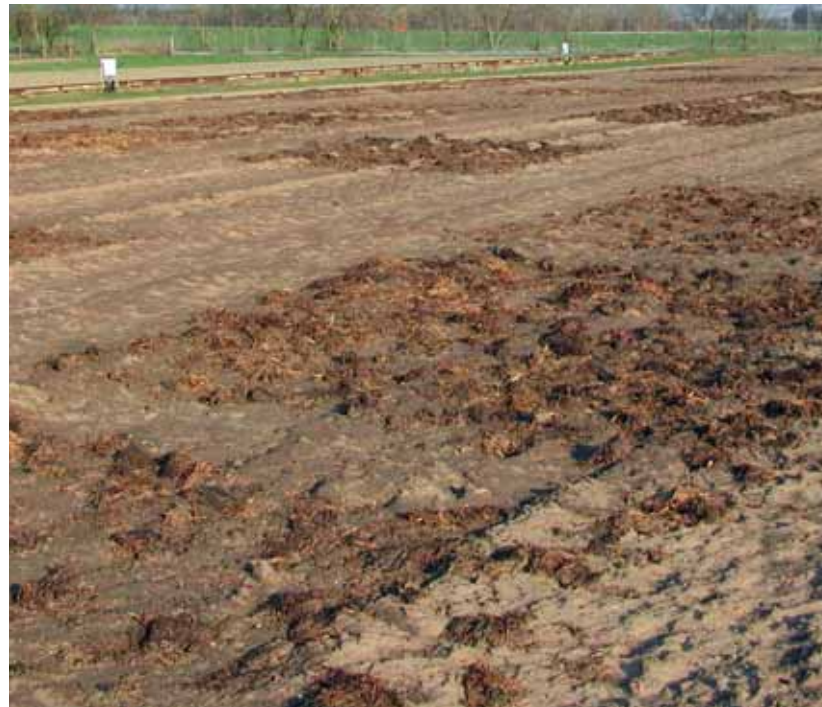
Abb. 1. Dauer-Düngungsversuch in Großbeeren nach Ausbringung von Stallmist. Sowohl im ökologischen als auch im konventionellen Landbau kann Stallmist einen wichtigen Beitrag zur Nährstoffversorgung von Pflanzen und Boden leisten. Eine genaue Vorhersage der Mineralisierung von organischen Düngern trägt dazu bei, die Nährstoffverluste an die Umwelt gering zu halten.

Die Ergebnisse zeigen, dass die Netto-N-Mineralisierung am Ende des Inkubationszeitraums im Boden mit historischer Stallmistdüngung am höchsten war, die des Bodens ohne Düngung in der Ver-