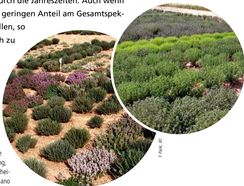
Abb.1: Verschiedene Thymian- und Bohnenkraut-Linien mit deutlichen Unterschieden in Farbe, Wuchs und Blühstadium.

Obwohl Gewürzpflanzen seit Jahrhunderten in Gebrauch sind, unterscheiden sie sich von anderen Kulturpflanzen doch dadurch, dass sie erst am Beginn ihrer züchterischen Bearbeitung stehen. Das heißt, sie sind aus dem Stadium der Wildpflanze bislang kaum herausgetreten. In verschiedenen Ländern oder Regionen werden daher zum Teil ganz unterschiedliche Formen verwendet, die sich nicht nur in ihrer äußeren Erscheinung, sondern auch hinsichtlich ihrer würzenden Inhaltsstoffe unterscheiden können. So ist Basilikum nicht gleich Basilikum und Oregano nicht gleich Oregano. Doch trotz dieser Vielfalt spiegelt das, was in den Küchen der Welt zum Einsatz kommt, nur einen kleinen Teil der Diversität wider, die in den entsprechenden Gattungen und Arten