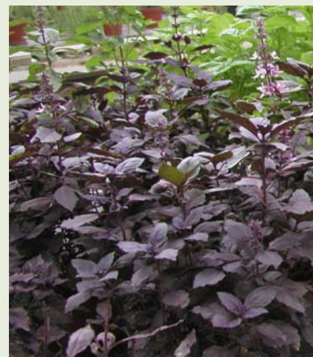
Abb. 3: Rot- und grünblättriger Basilikum