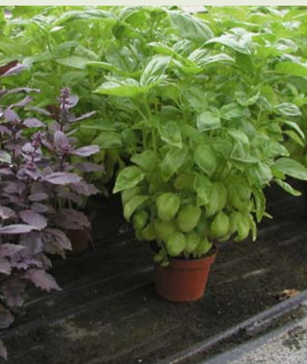
Abb. 4: Der Methyleugenolgehalt unterschiedlicher Basilikumsorten in Abhängigkeit vom Erntezeitpunkt

Dass in verschiedenen Gewürzpflanzenarten unterschiedliche Sekundärstoffe vorkommen, ist nicht überraschend. Die chemische Diversität ist aber auch innerhalb der Arten anzutreffen. Wenn diese Verschiedenartigkeit in den Inhaltsstoffen ein erblich konstantes Merkmal ist, spricht man gelegentlich von Chemotypen oder auch von „Chemischen Rassen“. Am Beispiel von Dillfrüchten kann man