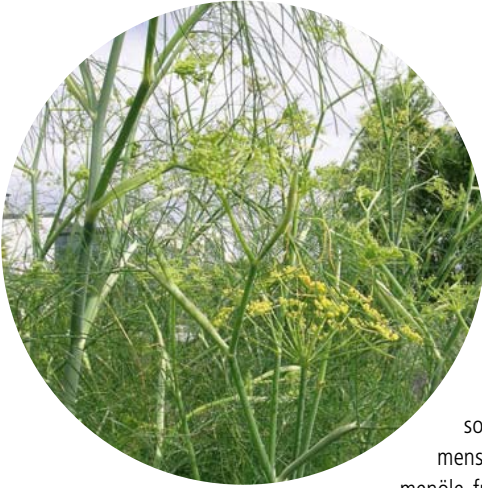
Abb. 5: Dillpflanzen im Bestand

sehen, dass weniger das äußere Erscheinungsbild, sondern vielmehr die Zusammensetzung der ätherischen Samenöle für die Charakterisierung der einzelnen Dill-Typen maßgeblich ist.