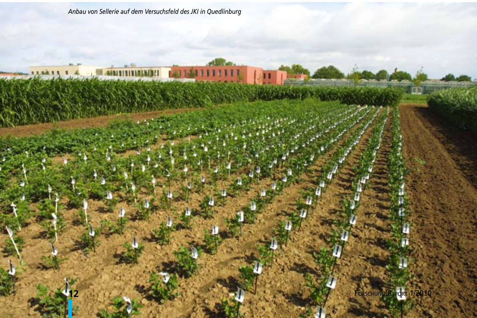
Anbau von Sellerie auf dem Versuchsfeld des JKI in Quedlinburg