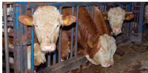
Bei Wegfall des Außenschutzes wären die deutschen Rindermastbetriebe im Vergleich zu Überseeländern nicht wettbewerbsfähig.